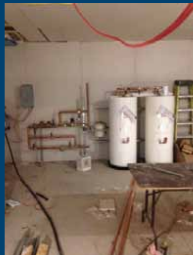
Salle mécanique au sous-sol

Le Phare du Blanchon en date du 9 décembre :