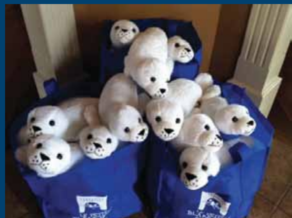
Mme Plante avait acheté à la fin de l'été les toutous blanchons pour la classe de sa fille à l'école Prés-Verts