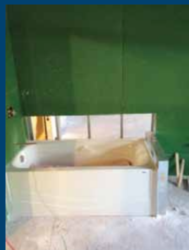
Travaux de plomberie